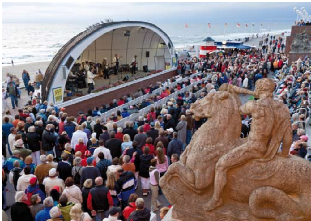
Kurkonzert in der Musikmuschel auf der Kurpromenade in Westerland; die Skulptur vorne wurde mit Blitz inklusive Warntonfolie aufgehellt.