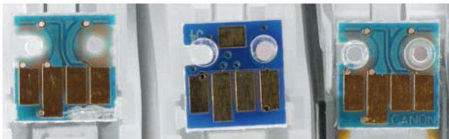
Rechts ist der Canon-Chip im Original zu sehen, den auch Digital Revolution benutzt, allerdings mit abgekratztem Schriftzug. In der Mitte ein Nachbauchip, wie ihn etwa Pelikan verwendet.

In Sachen Druckqualität gibt es zwei echte Ausfälle: Sowohl Ink Swiss als auch Pelikan zeigen einen deftigen Grünstich und eine starke Metamerie – je nach Art der Beleuchtung ändert sich die Farbwirkung kräftig. Da die Tanks auch äußerlich identisch sind, liegt hier nahe, dass sie baugleich sind. Auch die anderen Tinten können nicht mit der ausgewogenen und präzisen Farbwiedergabe des Originals konkurrieren und bei den Schwarzweiß-Prints schwächen sämtliche Nachbauer drastisch.