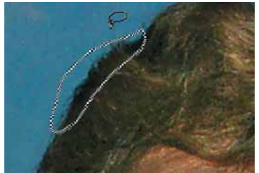
Abb. 4: Die Haarspitzen werden auf der linken Seite der Frisur in kleinen Teilen ausgewählt und kopiert ...