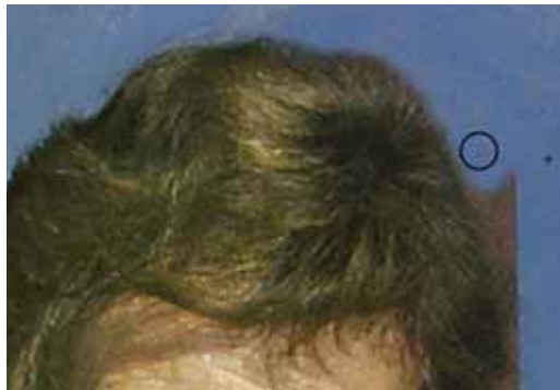
Abb. 3: Werden die Umgebungspixel einfach an die Frisur herangezogen, gehen die feinen, abstehenden Strähnen verloren.