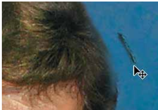
Abb. 5: ... dann jeweils als Ebene eingesetzt und angepasst, bis die Frisur wiederhergestellt ist.