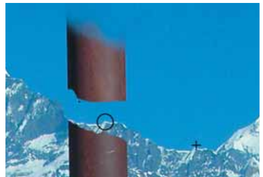
Abb. 2: Ein kleiner Pinsel mit einer harten Kante verlängert die Kammlinie und füllt das Gebirge auf.