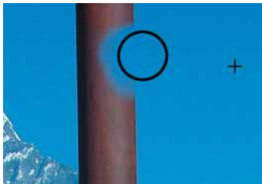
Abb. 1: Mit einem relativ großen, weichrandigen Pinsel wird die Stange im Bereich des Himmels überpinselt.