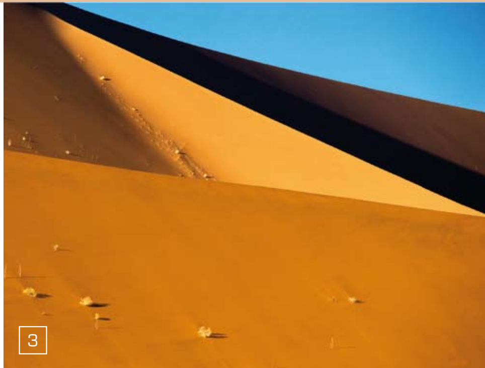
Abb. 1: Die weltbekannten abgestorbenen Bäume im Deadvlei in extremer Teleansicht, Morgenlicht Abb. 2: Die Sonne steht tief über dem Dünenkamm: schnelles Spiel mit Licht und Schatten Abb. 3: gestaffelte Dünen Abb. 4: Um das Schwergewicht nicht halten zu müssen, ist die Kamera/Teleobjektiv-Kombination (Nikon D700 mit dem AF-S Nikkor 600/4 D IF-ED VR II) auf ein Stativ montiert. Das erleichtert auch die Bildgestaltung und die Ausschnittsfindung.

und in jede Ritze kriecht. Es ist vor allem auch eine körperliche Herausforderung, ein Super-Teleobjektiv kilometerweit in der Wüste zu transportieren; es sollte dazu gut verpackt und bequem zu tragen sein (hier im Lowepro Lens Trekker 600 AW II). Aber die Schleppelei lohnt sich allemal: Dem weltbekannten, zigtausendmal fotografierten Motiv „Deadvlei“ lassen sich mit einem Teleobjektiv ganz neue Ansichten abgewinnen.