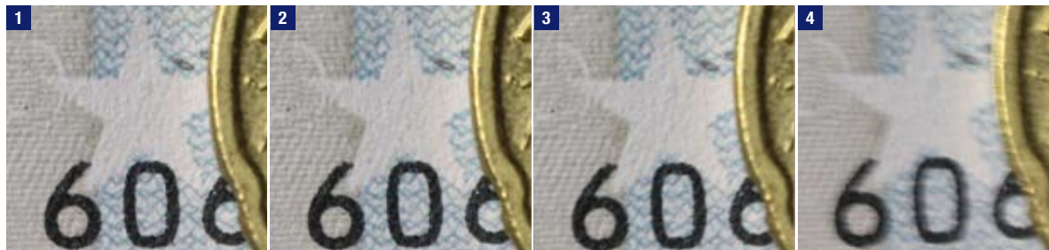
Typische Resultate bei einer Vergrößerung von ca. 1:1,5, von links nach rechts: