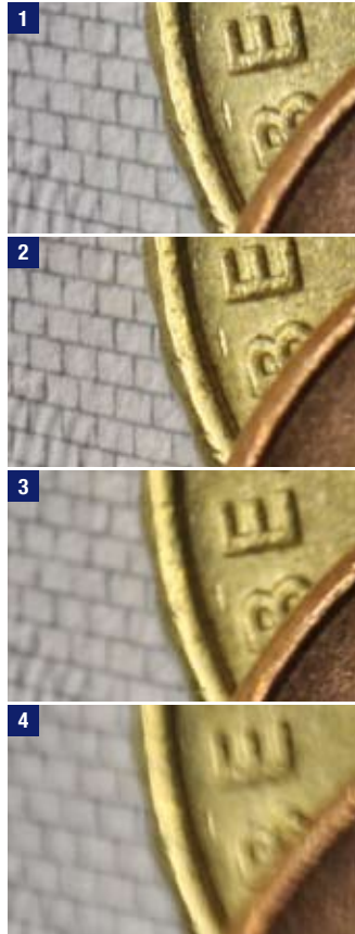
Typische Resultate bei einer Vergrößerung von ca. 1:5, von oben nach unten:

Darüber hinaus stellt sich die Frage, ob man in den Fällen, in denen der Hybrid IS wirklich Sinn macht, überhaupt viel frei Hand fotografiert. Gerade bei Makros, die wohl das primäre Einsatzgebiet des Hybrid IS darstellen, wird man mit Stativ arbeiten, da der Bildausschnitt recht klein ist und man oft manuell fokussieren muss.